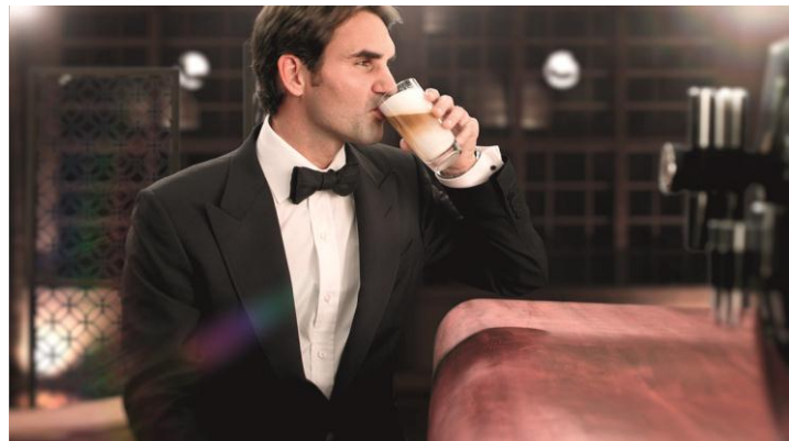
Bildunterschrift: Roger Federer genießt seinen Latte macchiato im neuen TV-Spot von JURA*