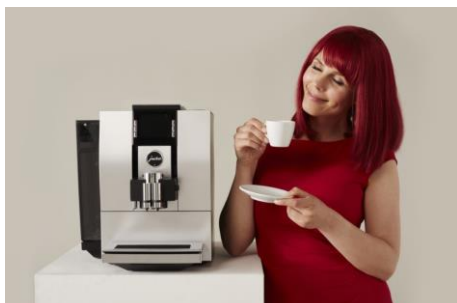
Miss IFA präsentiert Produktneuheiten zur IFA 2015: Kaffeevollautomat Z6 Satinsilber von JURA