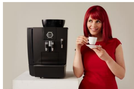
Miss IFA präsentiert Produktneuheiten zur IFA 2015: Kaffeevollautomat XJ6 Professional von JURA