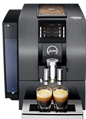
Perfekter Auftritt: Die JURA Z6 Carbon überzeugt mit Form, Farbe und Funktion

Abdruck honorarfrei – Belegexemplar erbeten. Das Bildmaterial erhalten Sie gerne auf Anfrage an den unten stehenden Pressekontakt. Copyright: Fotos bitte nur mit Quellenangabe JURA verwenden.