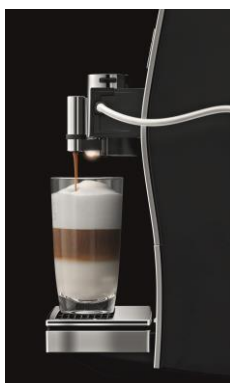
Feinster Milchschaum in zehn Temperaturstufen