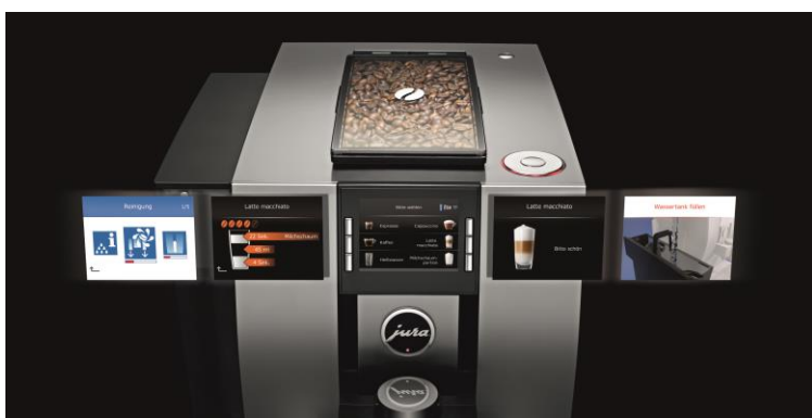
Durchdacht und übersichtlich: maximaler Bedienkomfort