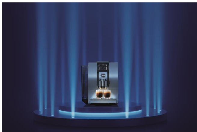
Strahlender Auftritt für exzellentes Design: die neue Z6 von Jura