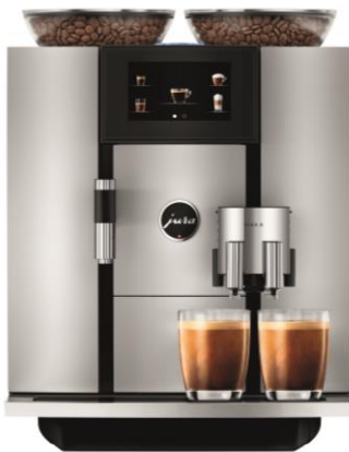
Erfolgsmodell: Die JURA GIGA 6