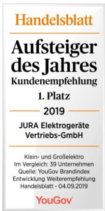
„Aufsteiger des Jahres“ Handelsblatt-Siegel